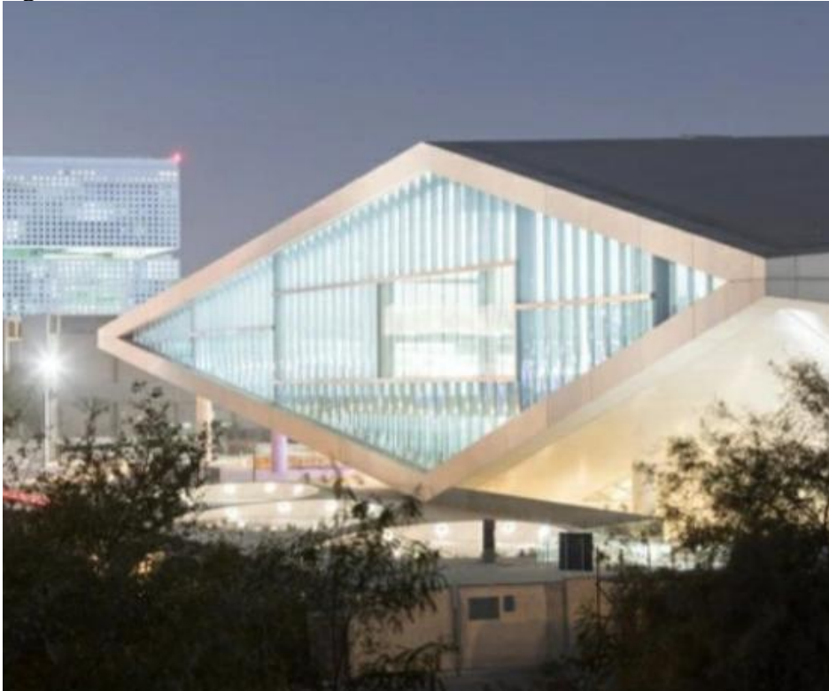
Figura 05 - Biblioteca Nacional do Catar