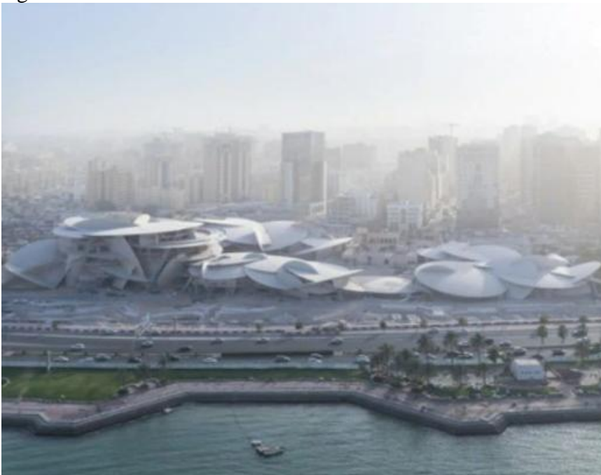
Figura 05 – Museu Nacional do Catar