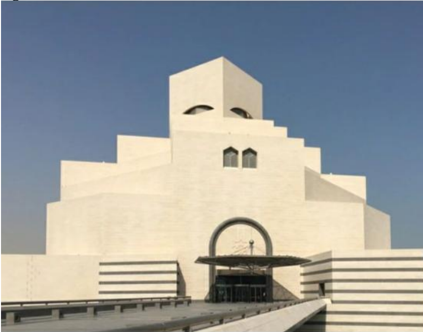
Figura 04 – Museu de Arte Islâmica